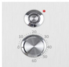
Regulacja czasu pracy